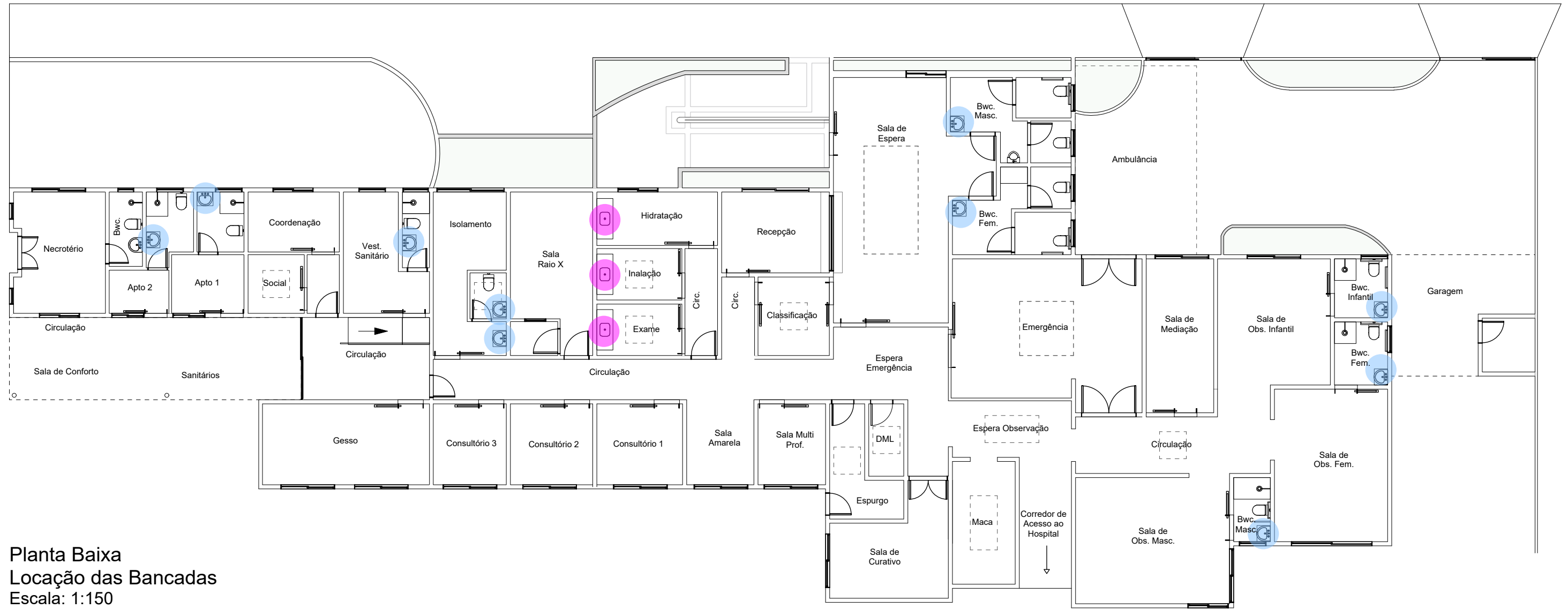
Planta Baixa Locação das Bancadas Escala: 1:150 Legenda: